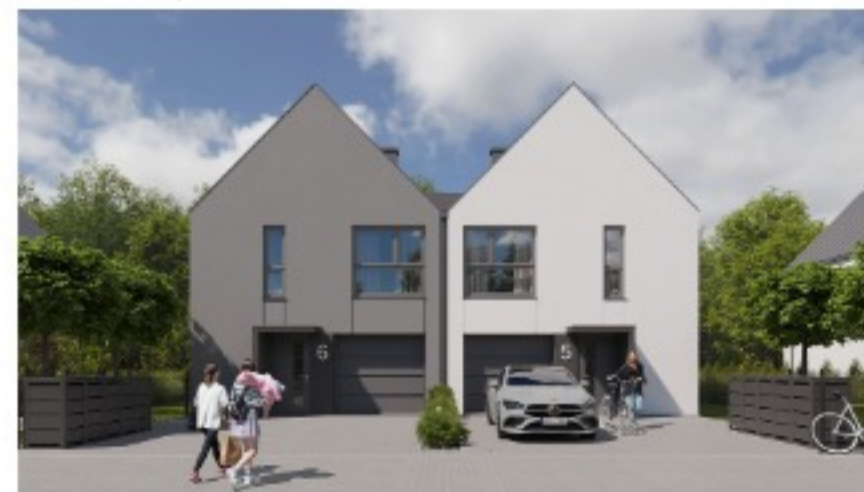
Widok przykładowego segmentu od frontu