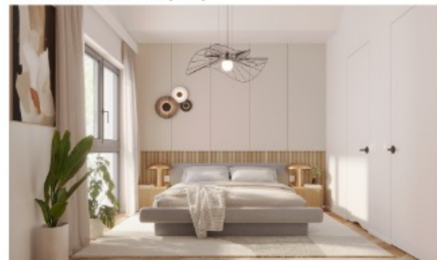
Widok na dużą sypialnię główną