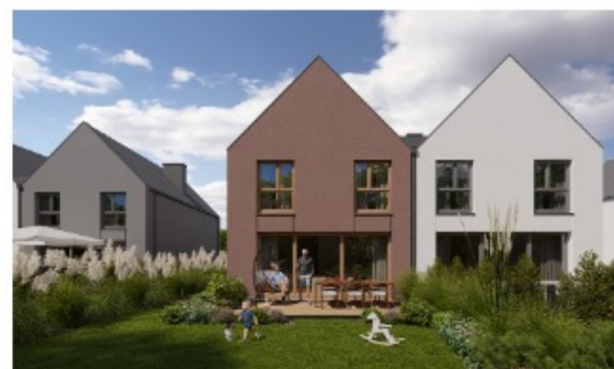
Widok na ogródek przykładowego segmentu