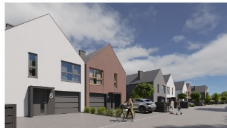
Widok na osiedle od strony ulicy