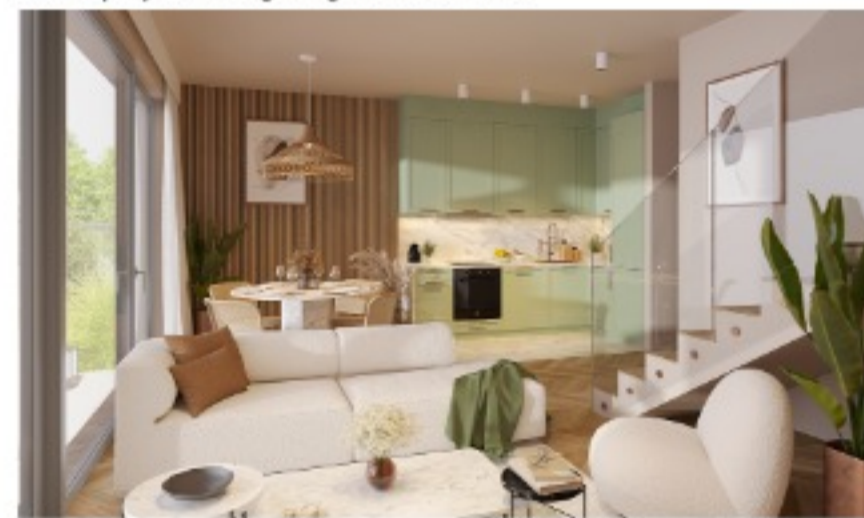
Widok na jasny salon z dużym przeszkleniem